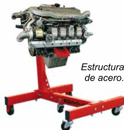
Estructura de acero.